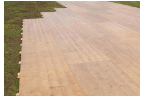
Plancher sur l'herbe sans support