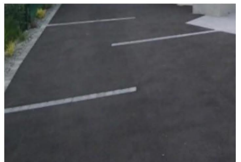
Sol en pente